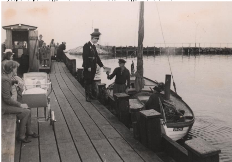
Kystpoliti på Dragør Havn – 1942.